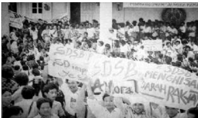
Foto 3. Demonstrasi anti SDSB di halaman gedung DPRD DIY.

Sebelum melakukan aksi pada tanggal 10 Desember 1991, Mahasiswa UGM, IAIN, UII serta perguruan tinggi lainnya juga menyukseskan renungan malam yang diadakan di kampus IAIN tanggal 9 Desember 1991. Kegiatan tersebut mengkritisi SDSB sebagai perampas hak hak ekonomi rakyat. Para mahasiswa mengancam akan melakukan aksi golput apabila tuntutan mereka tidak dipenuhi ( Bernas , 10 Desember 1991). Satu hal yang menarik dari aksi anti SDSB yang dilakukan mahasiswa adalah kalimat poster yang berbunyi "SDSB no, Golput yes". Bunyi poster tersebut dapat ditafsirkan bahwa jika tuntutan terhadap penghapusan SDSB tidak segera ditanggapi, Mahasiswa akan bersikap golput dalam pemilu yang akan dilaksanakan pada tahun 1992 ( Kedaulatan Rakyat , 13 Desember 1991). Kalimat poster lainnya yaitu "Kuliahku hancur gara gara bapakku pecandu SDSB", "Jangan jerat rakyat kami dengan SDSB", "SD Inpres yes, SDSB no", "jangan racuni kota budaya kami dengan budaya judi" dan beberapa kalimat poster lainnya ( Kedaulatan Rakyat , 4 Desember 1991). Kalimat poster tersebut menunjukkan betapa memuncaknya kekesalan mahasiswa atas dampak SDSB yang meracuni masyarakat.