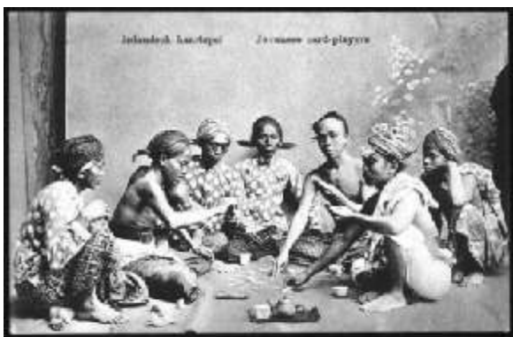
Foto 1. Kartu Pos Bergambar Perjudian di Jawa.

Orang Jawa khususnya masyarakat Yogyakarta sendiri banyak yang melakukan perjudian dengan berbagai ragam dan jenis perjudian, walaupun terdapat norma yang mengikat orang Jawa untuk tidak melakukan bebotohan atau judi. Jenis jenis perjudian yang sering dilakukan masyarakat di Yogyakarta di antaranya seperti adu jago atau sabung ayam, cliwik atau judi dadu, botoh Neker atau judi kelereng, gapple atau teplek (Domino), ceki atau kartu remi, ngépul atau bertaruh skor bola dengan kertas yang digulung. kemudian beberapa judi lotere , baik yang resmi ataupun tidak resmi. 9