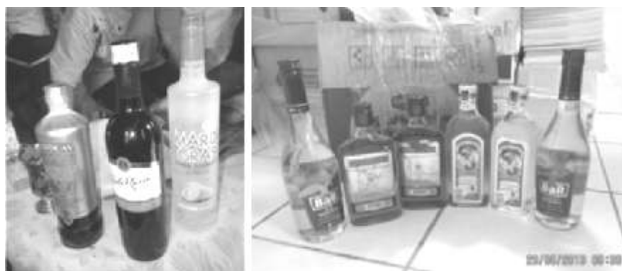
Foto 1. Barang bawaan pelintas yang diperjualbelikan sembunyi-sembunyi

Kecenderungan membawa minuman beralkohol dari wilayah Filipina memasuki wilayah Indonesia hanya dilakukan oleh beberapa pelintas batas terutama yang berasal dari desa Tinakareng Pulau Nanedakele. Nama-nama mereka dapat dilacak dalam dokumen pelintas batas, terindikasi lewat intensitas bepergian baik di wilayah Lintas Batas maupun di wilayah Kabupaten Kepulauan Sangihe. Sejauh penelusuran, barang-barang tersebut dapat ditemukan tidak hanya di Desa Tinakareng, atau juga di kompleks pertokoan dan pasar di Kota Petta, Tabukan Utara, tetapi juga ditemukan di beberapa tempat di Kota Tahuna. Alasan memperjualbelikan minuman beralkohol ini ialah “barang-koleksi” berupa kemasan minuman beralkohol dalam botol-botol kecil atau miniatur dari kemasan sebenarnya. Isi “barang koleksi” ini berkisar antara 50-100 ml., tergantung pada bentuk botol kemasannya. Selain kemasan “barang koleksi” juga tersedia kemasan untuk dikonsumsi. Untuk mendapatkannya, memerlukan pendekatan khusus atau ada orang yang menjamin si penjual bahwa pembeli yang dia bawa bukanlah aparat penegak hukum. Barang-barang yang diperjualbelikan secara sembunyi-sembunyi adalah jenis minuman beralkohol seperti digambar dibawah ini (Ulaen, 2012: 118-126).