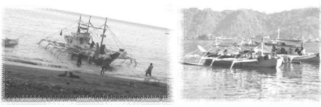
Foto 3. Fuso dan Pumpboat Pelintas melakukan bongkar muatan

Dalam hal persentase pelintas batas, seperti telah diungkapkan di atas bahwa tiga pulau di wilayah Kecamatan Marore yakni Pulau Marore, Matutuang dan Kawio memiliki persentase tertinggi sedangkan penduduk di Pulau Manipa, Bukide persentasenya rendah. Ini tidak dapat diartikan bahwa intensitas pelintas batas warga Marore, tinggi. Jika diperbandingkan dengan data dalam buku register pelintas keluar, maka warga Marore menggunakan waktu-tinggal sesuai izin yakni 59 hari kemudian kembali ke kampung halamannya. Dalam daftar tersebut ditemukan nama-nama warga Tinakareng yang lebih sering melakukan kegiatan melintasi batas. Ada yang namanya ditemukan hampir setiap bulan melakukan kegiatan melintasi batas. Hal ini mengindikasikan bahwa kepergiannya bukan semata untuk kunjungan keluarga, melainkan untuk berniaga.