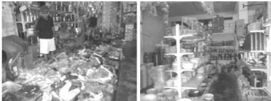
Foto 2. Barang bawaan pelintas yang diperjualbelikan di toko Gaisano di Tahuna

Barang-barang yang diizinkan untuk masuk dan keluar daerah perbatasan yang dikategorikan sebagai barang bawaan untuk keperluan hidup sehari-hari, dan dapat diperdagangkan jika nilainya melebihi 500 Pesos, maka dikenakan tax 10 persen.