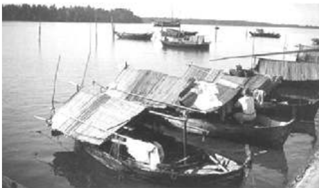
Foto 1. Kolek atau perahu tempat tinggal orang Sawang pada masa lalu

Orang Sawang di Belitung akan sangat marah apabila dikatakan atau disebut sebagai orang Sekak karena dianggap menghina mereka. Orang Sawang merasa bahwa ada stigma negatif dalam diri mereka apabila mereka disebut sebagai orang Sekak. Stigma negatif tentang orang Sawang memang berkembang luas pada masyarakat Melayu Belitung. Mereka memiliki gambaran bahwa orang Sawang itu boros, senang menenggak minuman keras dan tidak memiliki kemauan untuk hidup secara hemat.