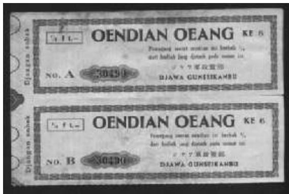
Foto 2. Kupon Lotere Oendian Oeang

Beragam Judi jenis kupon atau yang lebih dikenal dengan lotere banyak dijumpai pada tahun 1940an hingga 1970an. Lotere hadir di DIY dengan beragam wajah, salah satu yang terkenal pada waktu itu adalah jaw jie liang yang berpusat di Jakarta. Pengundian dilakukan setiap satu ataupun dua pekan sekali. Permainan lotere lainnya yaitu Undian Uang Besar yang diadakan setiap dua pekan. Pengumuman pemenang lotere yang beruntung mendapatkan hadiah dimuat di surat kabar Shin Po (Harian Shin Po, 29 Mei 1956).